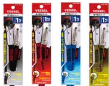
SC-W90K SC-W90R SC-W90B SC-W90D