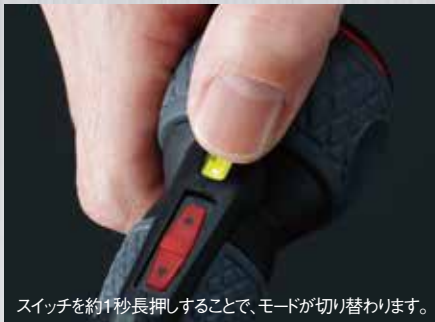
スイッチを約1秒長押しすることで、モードが切り替わります。