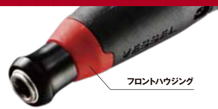
フロントハウジング