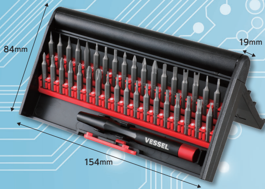
スタンド式ケース