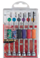
精密ドライバーセット TD-56