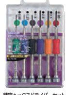
精密ヘッドドライバーセット TD-58