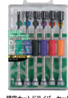
精密ナットドライバーセット TD-57