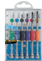
精密ドライバーセット TD-55