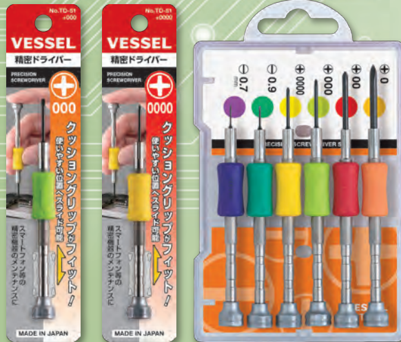
TD-51 +000 TD-51 +0000